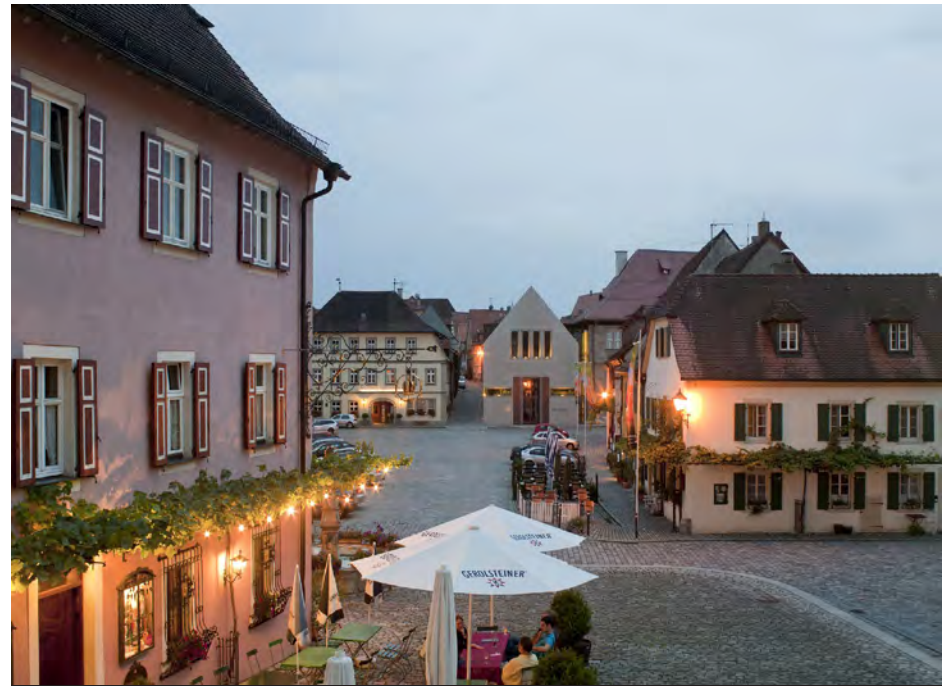
Blick über den Marktplatz Iphofens